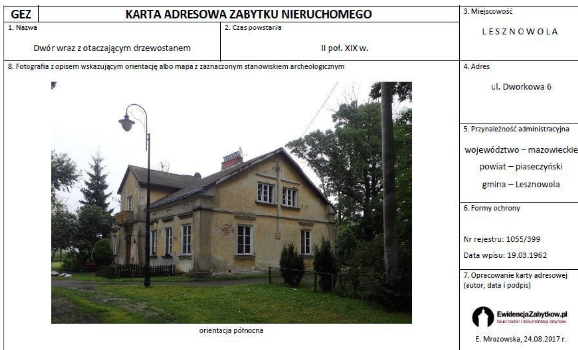
Ryc. 8. Przykładowa karta gminnej ewidencji zabytków gminy Lesznówola, awers