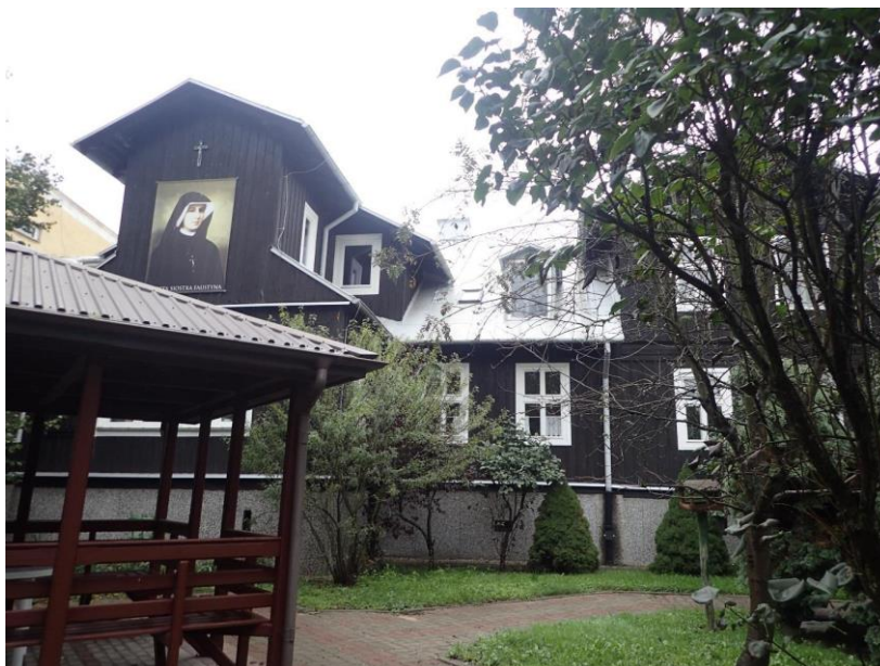
Ryc. 4. Dwór w Łazach