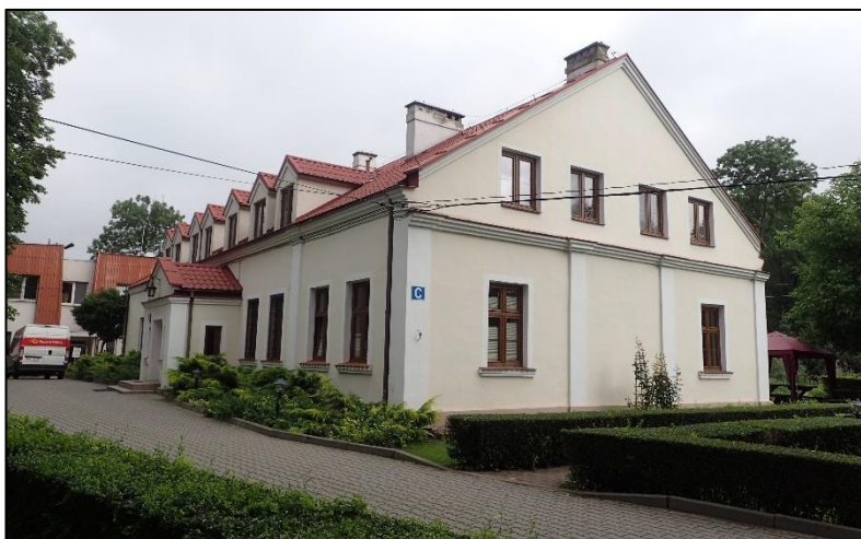
Ryc. 3. Dwór w Jastrzębcu

Do czasów wojny posiadłość nosiła nazwę Garbatka. W 1807 r. miejscowość liczyła 40 mieszkańców. Oprócz Jastrzębca w skład majątku wchodził Rosalin i Młochów. Właścicielem majątku w II poł. XIX w. był hrabia Zawisza. Dziś na terenie posiadłości działa Polska Akademia Nauk – Instytut Genetyki. Z dawnego majątku zachował się dworek po przekształceniach, park oraz zabudowania gospodarcze: stodoła, spichlerz i obora.