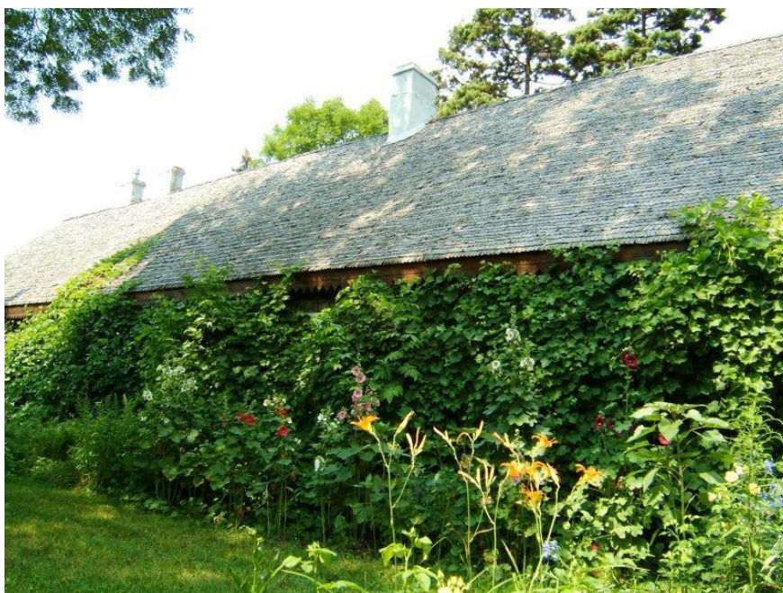
Ryc. 5. Dwór w Mrokowie