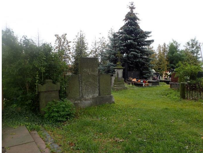
Ryc. 6. Cmentarz w Starej Iwicznej