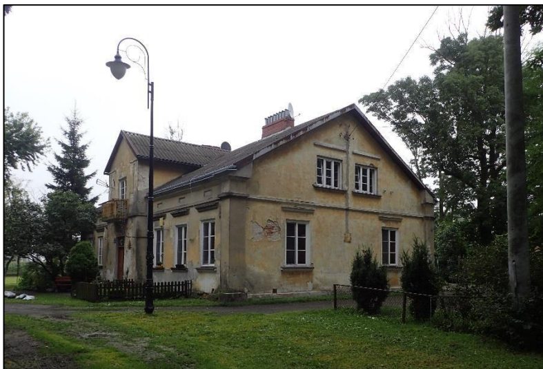
Ryc. 2. Dwór wraz z otaczającym drzewostanem w Lesznowoli