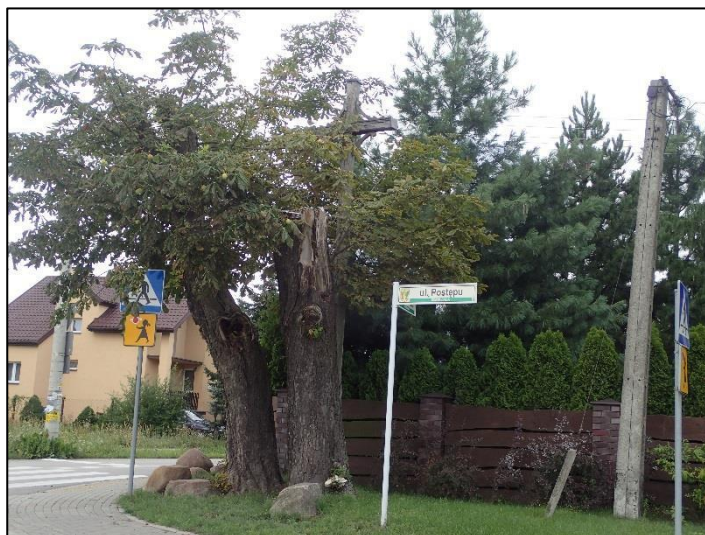
Ryc. 7. Cmentarz epidemiczny w Zgorzale

Cmentarz składa się z jednego krzyża drewnianego, umiejscowionego na rozwidleniu dróg.