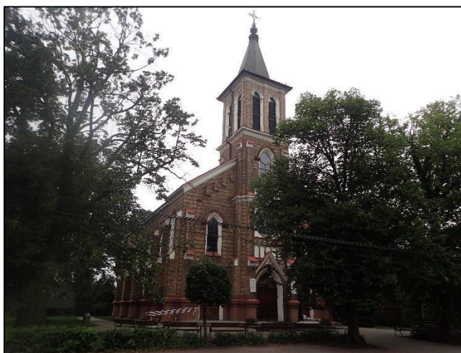
Ryc. 1. Kościół parafialny p.w. Zesłania Ducha Św. w Starej Iwicznej

Kościół pierwotnie ewangelicki, został zbudowany na miejscu wcześniejszego w 1893 r. Ze źródeł wiadomo, że pierwszy kościół powstał w 1843 r. Założony na rzucie prostokąta, z prezbiterium wydzielonym, zamknięty prosto z kruchtą, 3 kondygnacyjny,