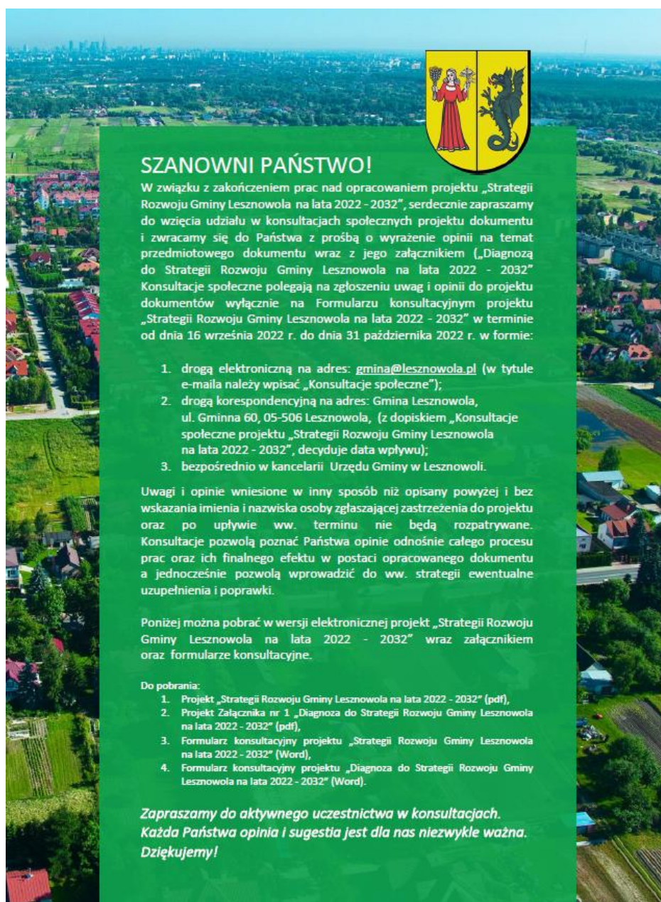
Rysunek 3. Ogłoszenie o przeprowadzeniu konsultacji społecznych zawarte na stronie internetowej Urzędu Gminy Lesznowola.