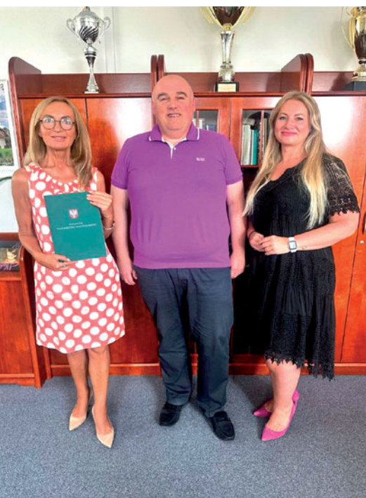
Podpisanie umowy w Urzędzie Marszałkowskim

• Zadanie – „Przebudowa ulicy Szerokiej w Garbatce, na odcinku od ul. Postępu do granicy gminy Lesznówola”. Kwota dotacji: 360 000,00 zł. Zadanie polega na przebudowie nawierzchni ul. Szerokiej z nawierzchni gruntowej na nawierzchnię utwardzoną nakładką asfaltową o długości 760,00 m. Droga ta prowadzi i przebiega przez tereny rolnicze, które mają istotne znacze-