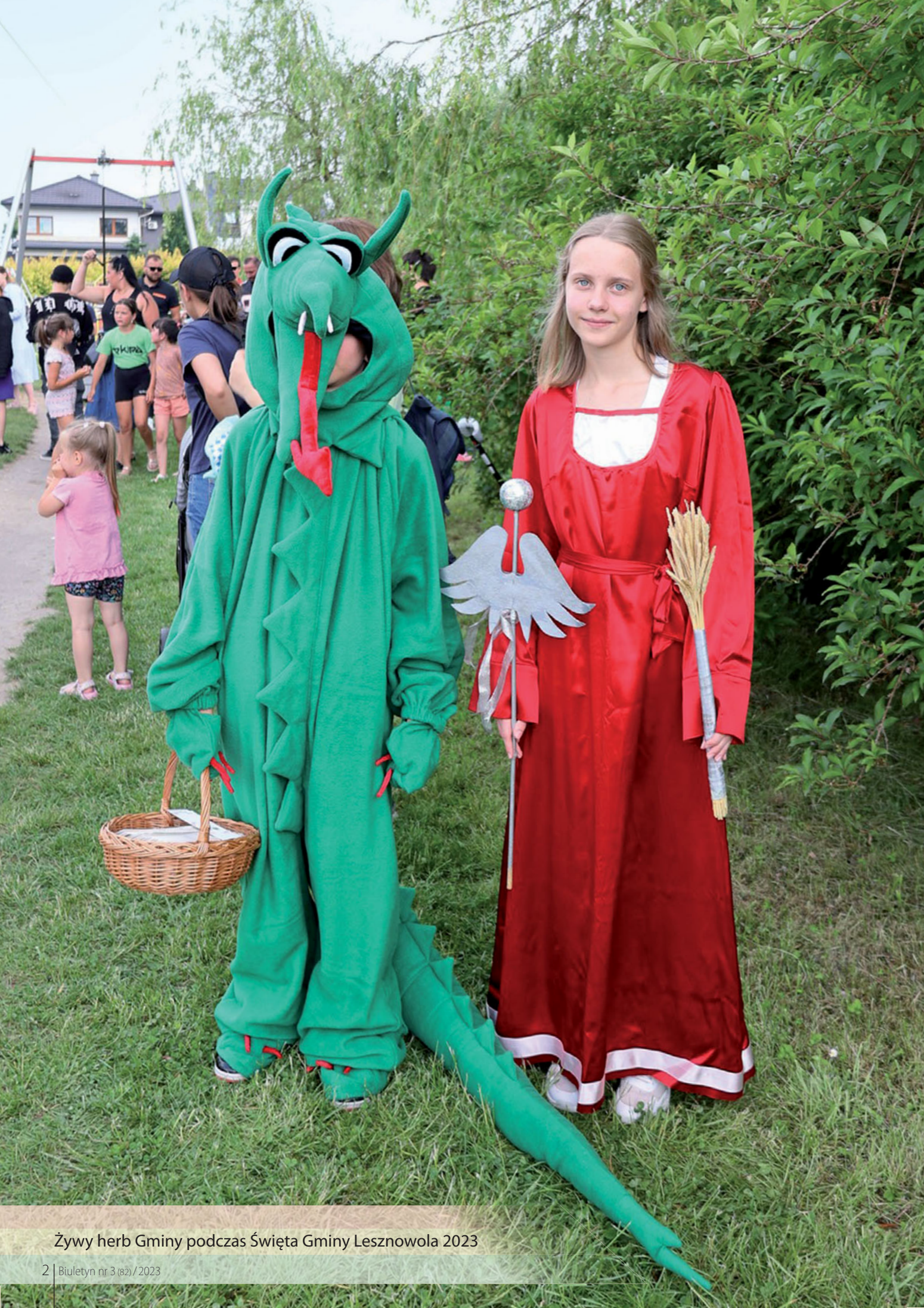
Żywy herb Gminy podczas Święta Gminy Lesznowola 2023