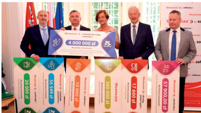
Uroczyste podpisanie umów w Brwinowie