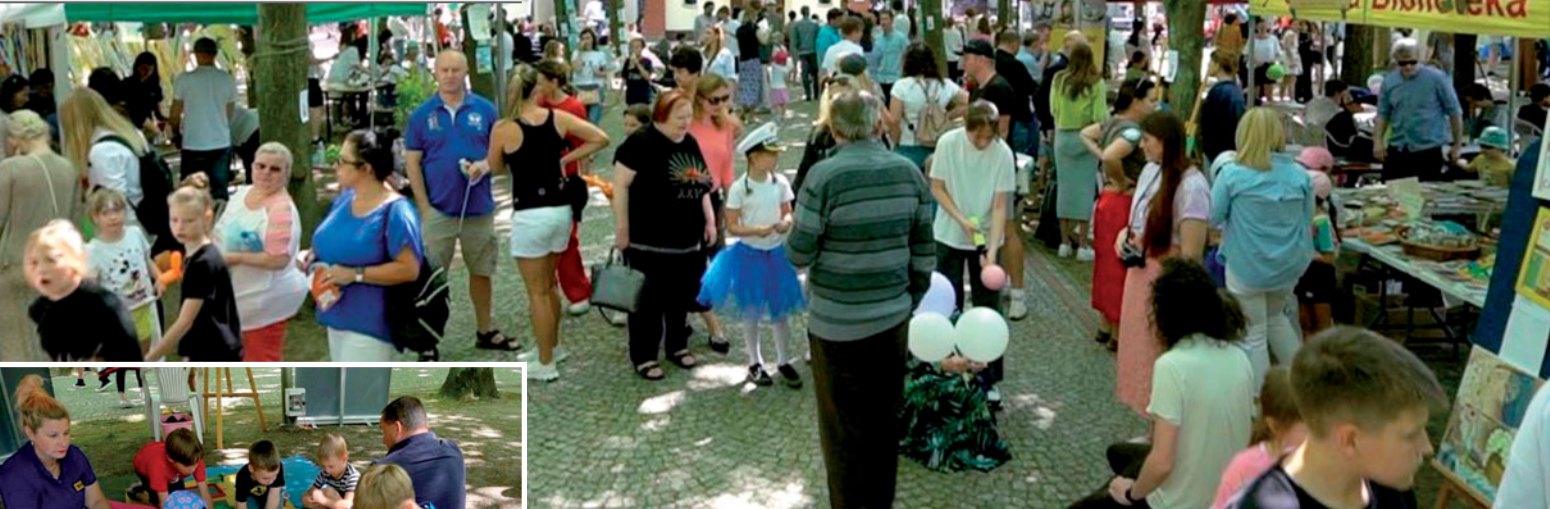
Piknik rodzinny Magdalence