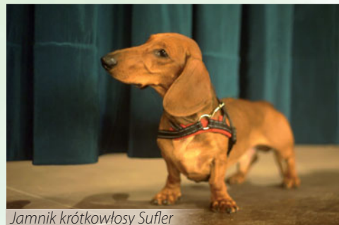
Jamnik krótkowłosa Sufler

W sierpniu zapraszamy Państwa na dwa wydarzenia patriotyczne, które będą się odbywać na terenie naszej gminy: