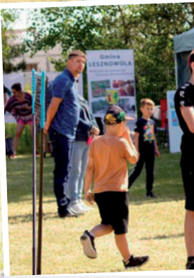
DZIEŃ DZIECKA w Warszawiance – 3.06.2023