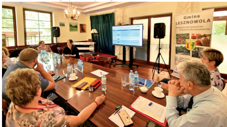
Spotkanie w Centrum Integracji Społecznej w Magdalence