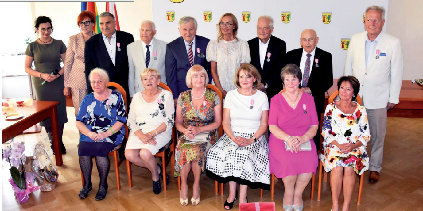
Pamiątkowe zdjęcie par z uroczystości Złotych Godów