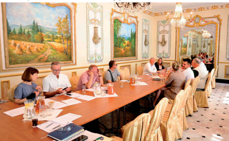
Spotkanie MZPwGL w Hotelu Książę Poniatowski