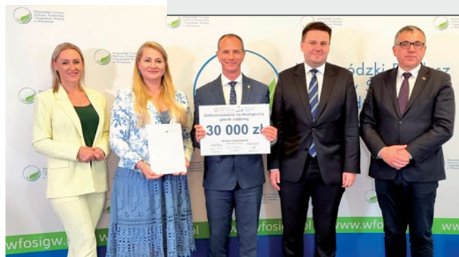
Uroczyste podpisanie umowy w siedzibie WFOŚiGW

nie dla prowadzenia działalności związanej z różnymi uprawami. Zaplanowana przebudowa wpłynie na ochronę gruntów rolnych i poprawę warunków gospodarowania. Wartość kosztorysowa inwestycji to 1 059 100,43 zł.