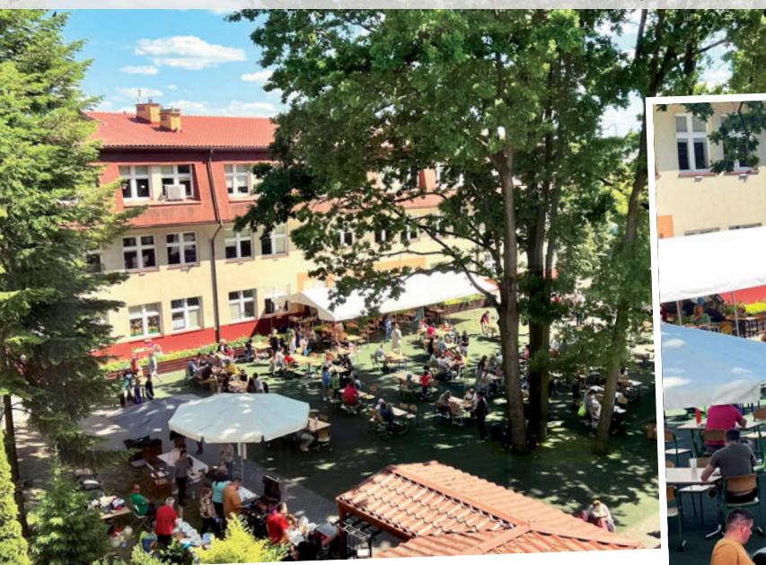
PIKNIK RODZINNY przy ZSP w Lesznowoli – 3.06.2023

Wraz z cieplejszą pogodą rozpoczyna się sezon imprez plenerowych. Zapraszamy na fotorelację z wydarzeń organizowanych w naszej Gminie.